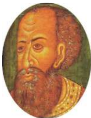
Царь Иван IV Грозный