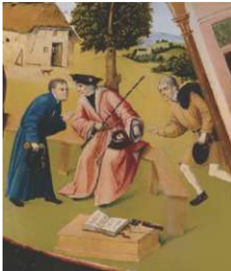
Фрагмент «Алчность» картины Иеронима Босха «Семь смертных грехов»

Рассматривая участников коррупции на примере взяточничества, стоит отметить, что в коррупционном процессе всегда участвуют две стороны. Одна сторона — это взяткополучатель (подкупаемый). Вторая сторона — это взяткодатель (осуществляющий подкуп). Также в процессе может участвовать и третья сторона — посредник.