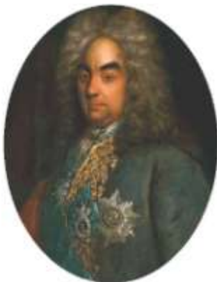
Петр Андреевич Толстой